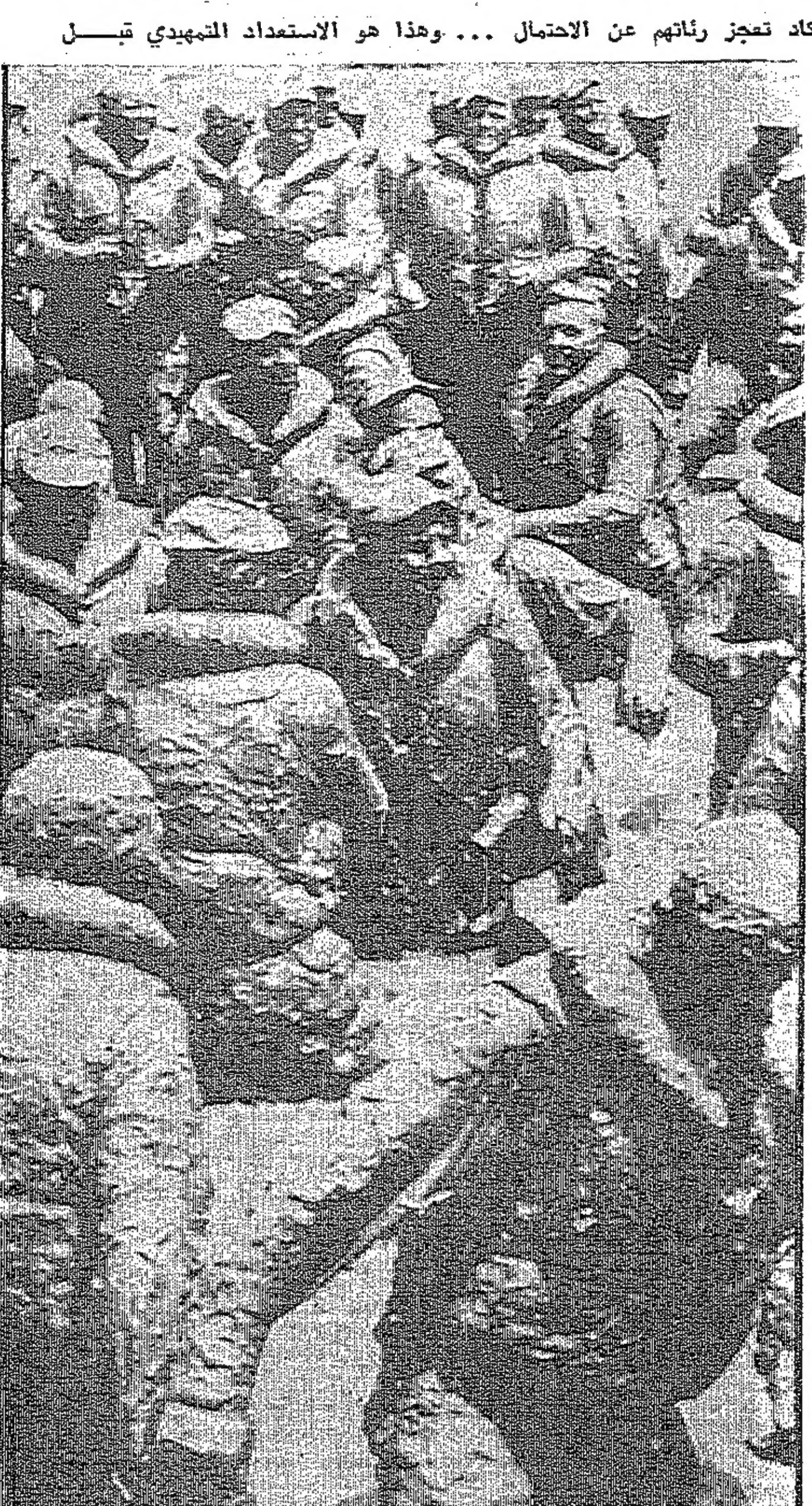
يحصون انفسهم تحت الماء حتى تكاد تميز رئاتهم عن الاحتمال... وهذا هو الاستعداد التهديدي تيسل تدريبهم على الفوضى في الوحل!